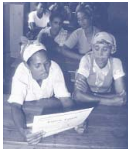
Por primera vez, la mayoría de las mujeres africanas ha sido alfabetizada

Un mayor número de mujeres accede a la educación y lo hacen a un ritmo más acelerado que los hombres. Las nuevas cifras del Instituto de Estadísticas de la UNESCO muestran que en el período 1995-2000 la proporción de mujeres analfabetas de 15 años de edad, se redujo del 28,5 por ciento al 25,8 por ciento. La tendencia es evidente en todas las regiones aunque es particularmente alentadora en África donde, por primera vez, la mayoría de las mujeres han sido alfabetizadas.